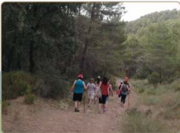
Recorriendo el sendero del Monte de Abajo.