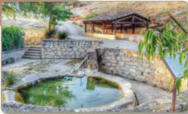
Lavadero y manantial.