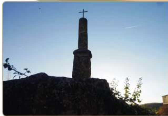
Anochecer en la Cruz del Cura.