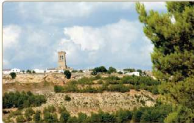
Vista de Cuevas de Velasco desde la carretera local.