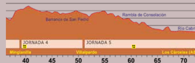
El perfil representa el sentido norte-sur