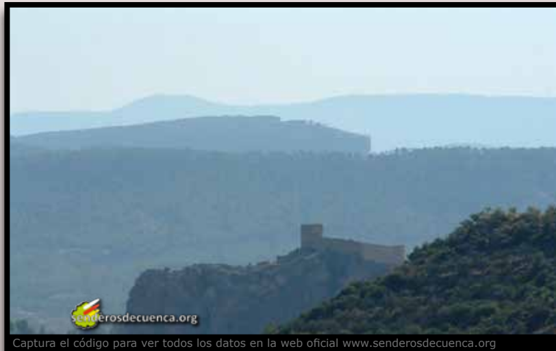
Captura el código para ver todos los datos en la web oficial www.senderosdecuenca.org

Asociación de Municipios Valle del Cabriel