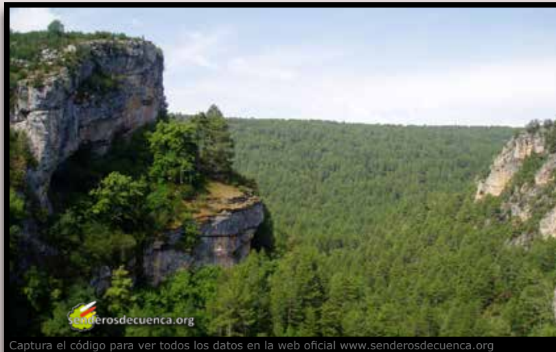
Captura el código para ver todos los datos en la web oficial www.senderosdecuenca.org

El Sector A del GR 66, creado en 1991, fue el primer sendero homologado en la provincia de Cuenca y el segundo en Castilla La Mancha, tras el GR 10 en Guadalajara. El proyecto original comprende un dilatado trazado que cruza la provincia de Cuenca por el extremo este. En la actualidad sólo tres tramos inconexos están homologados, los cuales se recogen en las siguientes páginas.