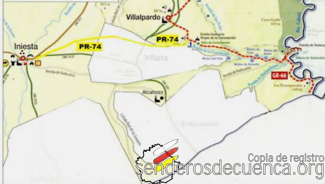
Imagen adaptada del original en el folleto de senderos del Valle del Cabriel e Hedo por la Asociación de Municipios Ribera del Cabriel.

Longitud: 11'6 Km. Dificultad: Fácil Tiempo aprox. (*): 2 h. 54' Cotas: Máx. 805 m. / Min. 719 m.