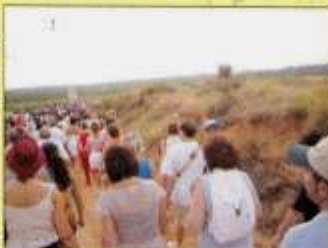
Imagen de la tradicional Romería de la Virgen de Consolación

Manteniendo el sentido recto del camino en todos los cruces llegamos al "Bolo" o "Cuco", construcción privada a modo de casilla de tejado en forma cónica que es refugio ante adversidades del clima y que forma parte del patrimonio arquitectónico popular y tradicional de la comarca de la Manchuela.