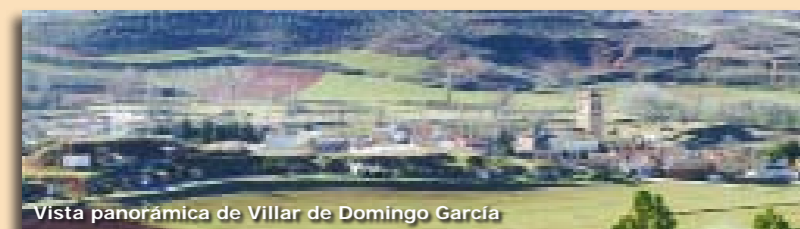
Vista panorámica de Villar de Domingo García

Los Senderos de Pequeño Recorrido homologados, se encuentran unificados y regulados a nivel estatal, lo que asegura la garantía de calidad en todos los recorridos.