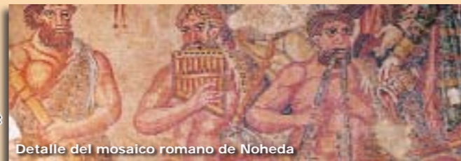
Detalle del mosaico romano de Noheda

Recordar que al caminar paralelos a una carretera debemos hacerlo siempre por la margen izquierda, fuera de la calzada, en fila y con precaución, prestando especial atención a los vehículos.